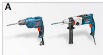
> Elektronarzędzie sieciowe i technika pomiarowa