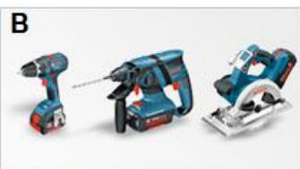
> Narzędzie akumulatorowe z technologią litowo-jonową (z/bez akumulatora/ładowarki)