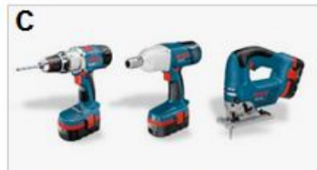
> Narzędzie akumulatorowe z technologią niklową