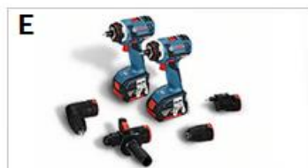
> Wiertarko-wkrętarka akumulatorowa GSR 14,4/18 V-EC FC2 z systemem FlexiClick