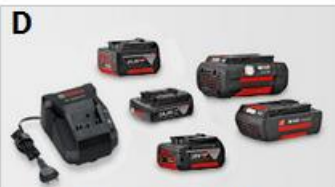
> Akumulator/ładowarka Li-Ion